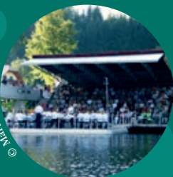
Karin Ploderer ©

Unter Anleitung der Singleiterinnen werden gemeinsam mit dem Publikum Lieder aus aller Welt gesungen – mit einfachen Texten und Melodien. Niemand braucht Vorkenntnisse, alle können sich entspannen und beherzt mitsingen, tönen, tanzen und schwingen, denn: das Singen ist so ansteckend, dass kaum jemand nur zuhören kann.